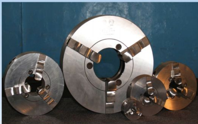
Самоцентрирующие токарные патроны